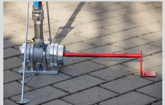
Endstütze verhindert ein Umkippen des letzten Regners in der Reihe

Nach dem Einsatz die Verstellmuffe der Standfüße lösen und nach oben schieben, bis die Ketten stramm sind, und wieder festziehen.