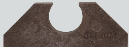
Vor dem Einsatz: Schlauchdrallstopper