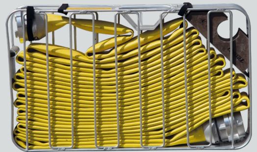
Für den Transport: Düsenschlauch im DIN-Schlauchtragekorb